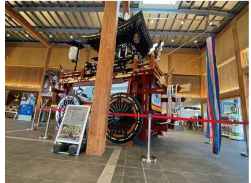
あかいべるとの なかには はいれません